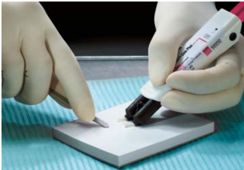
Wygodny podajnik Clicker, umożliwiający precyzyjne dozowanie w proporcjach 1:1

Dzięki podajnikowi Clicker dozowanie materiałów jest precyzyjne i higieniczne. Pasty mieszane są w odpowiednich proporcjach a uzyskany cement posiada optymalne właściwości.